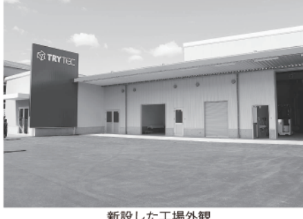
新設した工場外観