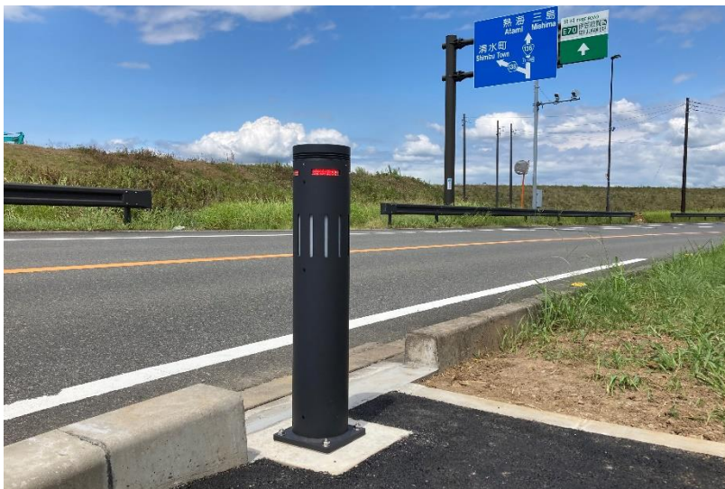
国道 136 号に設置された冠水センサ付きポラード

実証試験では、冠水検知情報を道路管理者や関係機関に通知し、道路パトロールや通行止めなど、道路管理オペレーションへの有効性などの検証を行います。