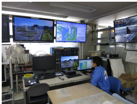
令和 2 年 9 月 1 日に実施された防災訓練の様子

なお、台風シーズンに備え、本年9月末までに冠水センサ付きポラード（車止め）を2箇所増設し、函南町ならびに伊豆の国市内の計 4 か所で運用を開始する予定です。